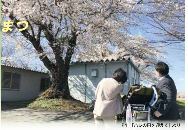
P4 「ハレの日を迎えて」より