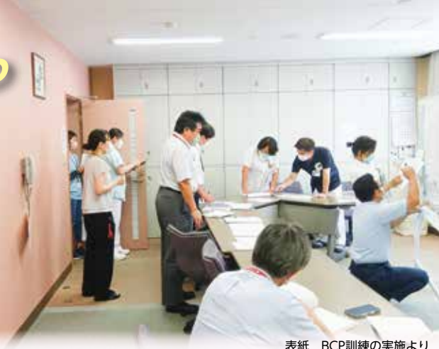
表紙 BCP訓練の実施より