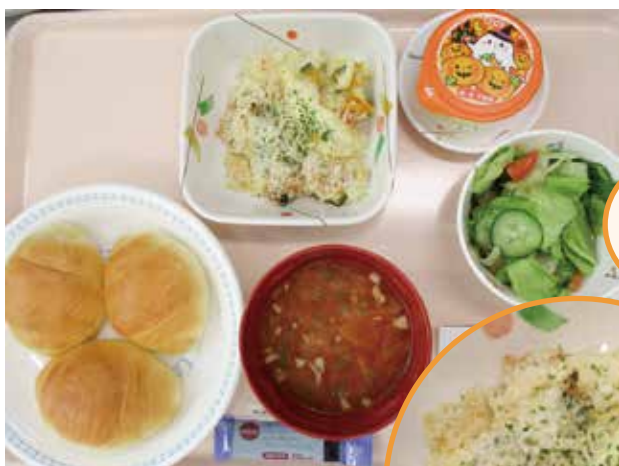
初めての かぼちゃの グラタン

今後も、みなさまに喜んでいただけるような、楽しくておいしい食事作りを心がけていきたいです。