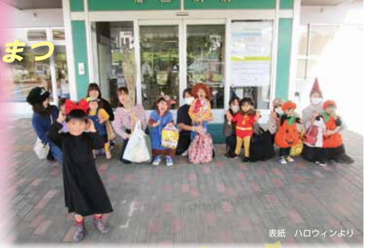
表紙 ハロウィンより