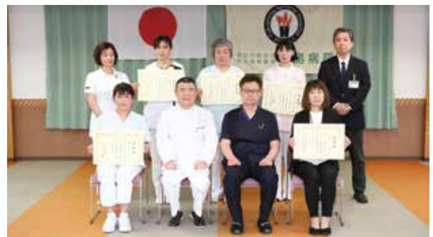
●永年勤続表彰20年、30年の皆さん