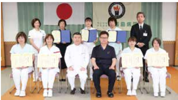
●永年勤続表彰10年、20年の皆さん

これから65歳定年まで10年強となりますが、その時々自分のすべきことは何かを考え、少しでも貢献できるように無理せず頑張りたいと思っております。今後とも皆様方からのご指導、ご鞭撻をいただきながら、微力ながら福島病院の一員として働いて参りたいと思っておりますので、今後ともよろしくお願いいたします。