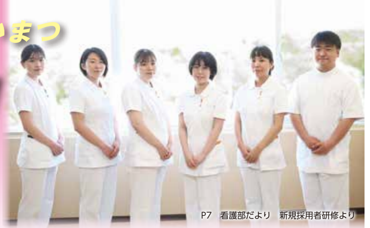
P7 看護部だより 新規採用者研修より