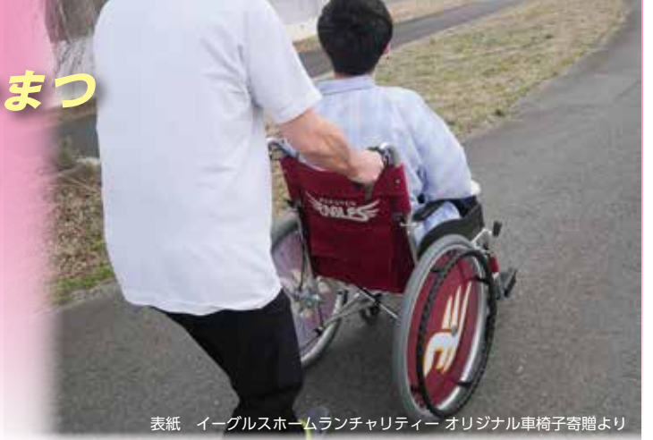
表紙 イーグルスホームランチャリティー オリジナル車椅子寄贈より