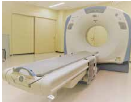
● 16列マルチスライスCT装置 GE 社 BrightSpeed (2013年9月～稼動)