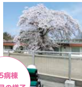
5病棟 お花見の様子