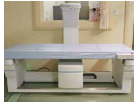
● 骨密度測定装置 (DEXA 法) Hologic 社 Horizon Ci (2018年7月～稼動)