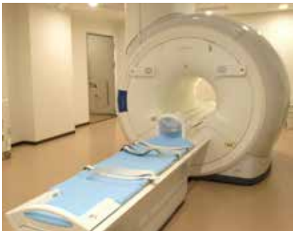
● 1.5T MRI装置 PHILIPS 社 Prodiva CS (2019年10月～稼動)