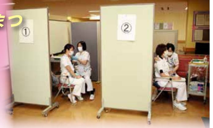
P2 新型コロナウイルスのワクチン接種についてより