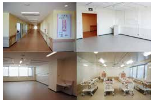
8月に移転し運用開始した第6病棟（中央診療棟3F）