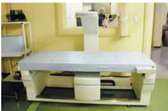
骨塩定量装置検査

GE 社製 Bright Speed SD 全身検査対応 マルチスライス CT で多断面断層 3D の表示が可能