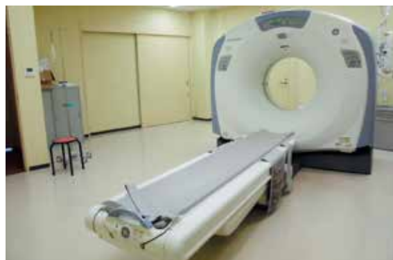
16列マルチスライスCT装置

PHILIPS 社製 Prodiva CS 1.5T 心臓・乳房を除くほぼ全身の検査に対応