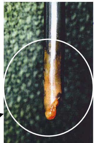
挿管チューブ先端